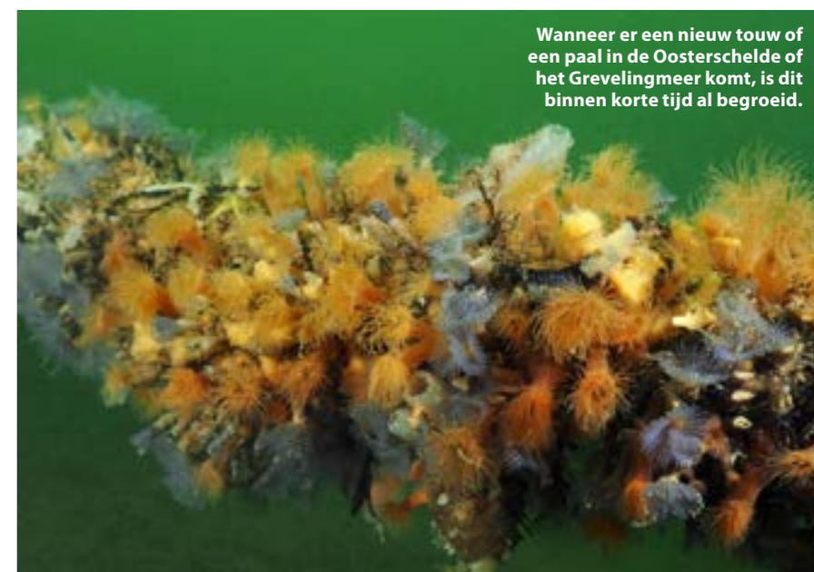
Wanneer er een nieuw touw of een paal in de Oosterschelde of het Grevelingmeer komt, is dit binnen korte tijd al begroeid.

Neem een fotowedstrijd voor onderwaterbeelden in Zeeland en bij de inzendingen zullen ongetwijfeld veel beelden zitten van begroeide objecten.